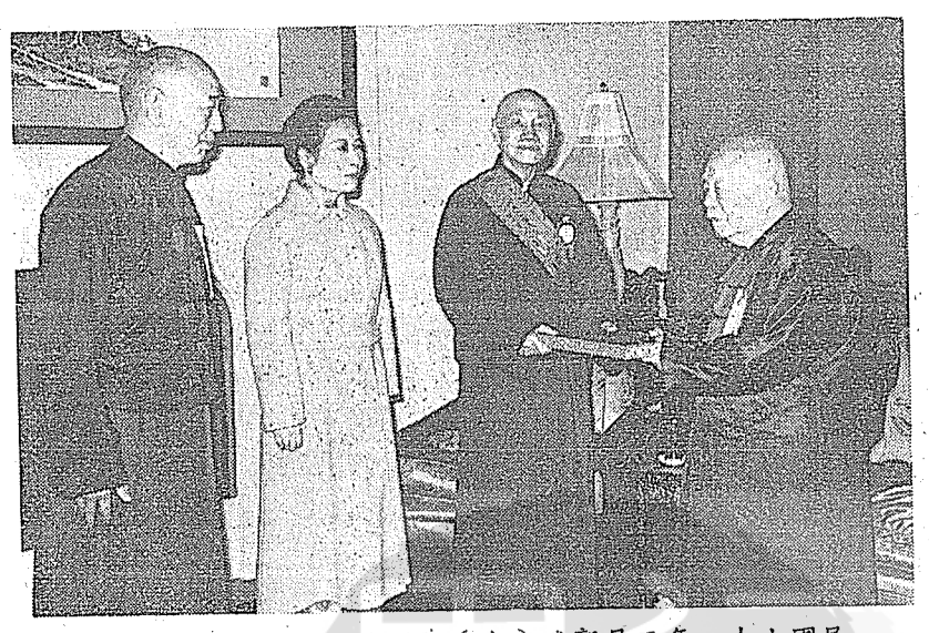
書秘會大民國任( 雲王同 表代五 右 介公將向 留時書

有「囘之爲人也,擇乎中庸,得一善則 拳拳服膺,而弗失之矣。」的崇高風格 綜合的人,因為他具有中庸的性格,真 郭澄鏡秋兄是一位擅於調和又長於