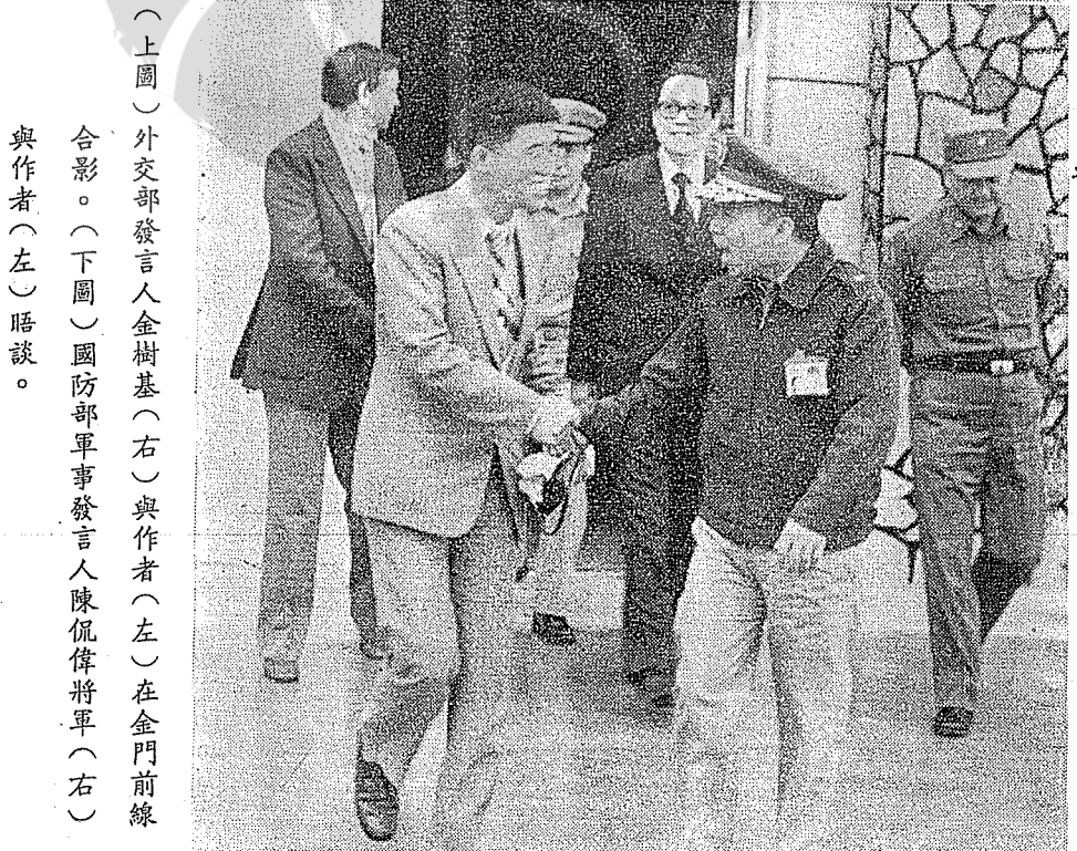
（上圖）外交部發言人金樹基（右）與作者（左）在金門前線合影。（下圖）國防部軍事發言人陳侃偉將軍（右）與作者（左）晤談。