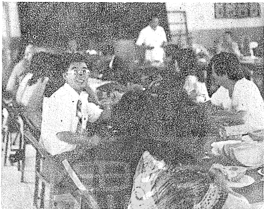
作者(左)參觀鳳山園藝改良所聆聽所長簡報。

位。目前已有三個貨櫃樞運中心，預計在七十年代 ，將有十一座貨櫃碼頭，十三台貨櫃起重機。 隨後，我們乘坐遊艇遊港一週，在港的兩岸 ，有許多家私人拆船業，業務發達，利潤也高， 難怪台灣的拆船業占世界第一位，但相反的也帶 來了不良的影響——海洋污染。