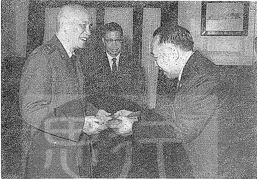
七石介公蔣 祝恭國返生師院學正中領率長院天事鮑月十年二十五國民 (爵天黃長員委副務僑前為中)影留時品念紀獻呈壽嵩六晉秩