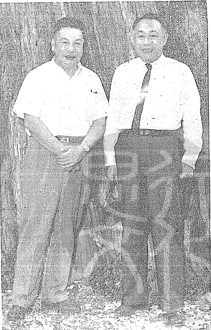
民國五十年八月陽明山會談後，今總統蔣經國先生（左）招待各代表同遊東西橫貫公路與鮑事天院長（右）合影。

菲律賓是海外華僑教育最普及也最完整的一個國家，全菲僑胞不過五十萬人，各級僑校却有一百六十多所，真說得上是有中國人的地方，就有華僑學校，其中除極少數以地處偏僻，師資設備有因陋就簡之處，但一般說來，都是根據國內教育部的法規和教學制度，採用部定教科書，有很好的水準和成績。而這所當年為仰慕先總統蔣中正先生而命名創立的中正中學，一直得風氣之先，是僑校中的領導。而自一九四五年詩田先生開始代理校長，主持校政起，學校即積極擴充設備，提高師資，對學生學業要求更加嚴格，大考小考從不放鬆；學校為加強對中國文字書法之重視，規定學生於正規課程之外，經常練習大楷小楷，於每週繳由國文教師詳加評核，作為課業成績的一部份，不得稍有缺漏。猶憶一九五七年秋天，我獲得東南亞獎學金赴馬尼刺菲律賓大學就讀時，承詩田先生愛護，要我在中正講授高初中國文各一班，我起初以為僑生成績低落，講課