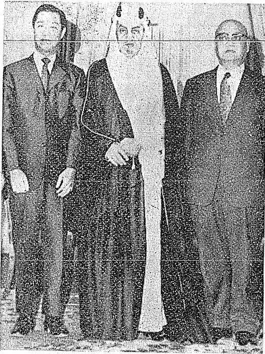
本文作者（右）六十一年元月出席沙國國宴後在費瑟國王宮留影，中為費瑟國王，左為田寶岱大使。

「際茲回教國家遭受外力侵略，國際共產匪徒到處製造恐怖暴亂，椰山主義（Zinism）以及