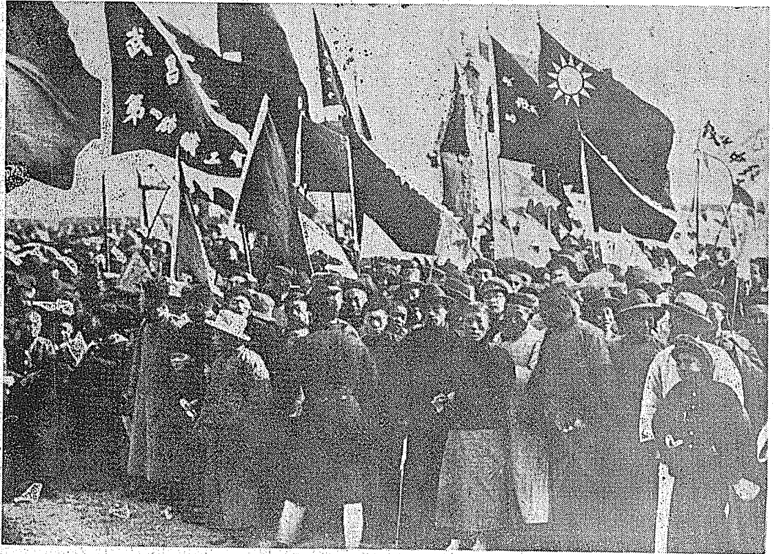
。景情之利勝伐北祝慶令司總蔣迎歡界各西江，昌南克攻軍革命民國年五十國民

建軍，並免國民黨三都督職務。國民黨於是發動二次革命，但不幸失敗。從民國二年到五年，蔣公在上海先後進行討袁，冒險犯難，使袁軍喪膽。民國五年，袁死後，軍閥混戰，南北政府對立。國