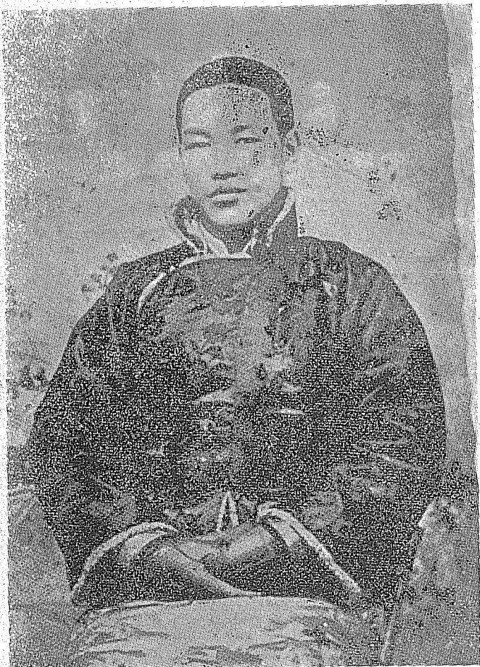
民前九年蔣公介石十七歲時留影。

牲下，創建起來，為中華民族五千年的歷史，寫下了嶄新的一章。可是民國成立以來，內有軍閥的爭權奪利，政客的營私玩法，黨人的意見分歧