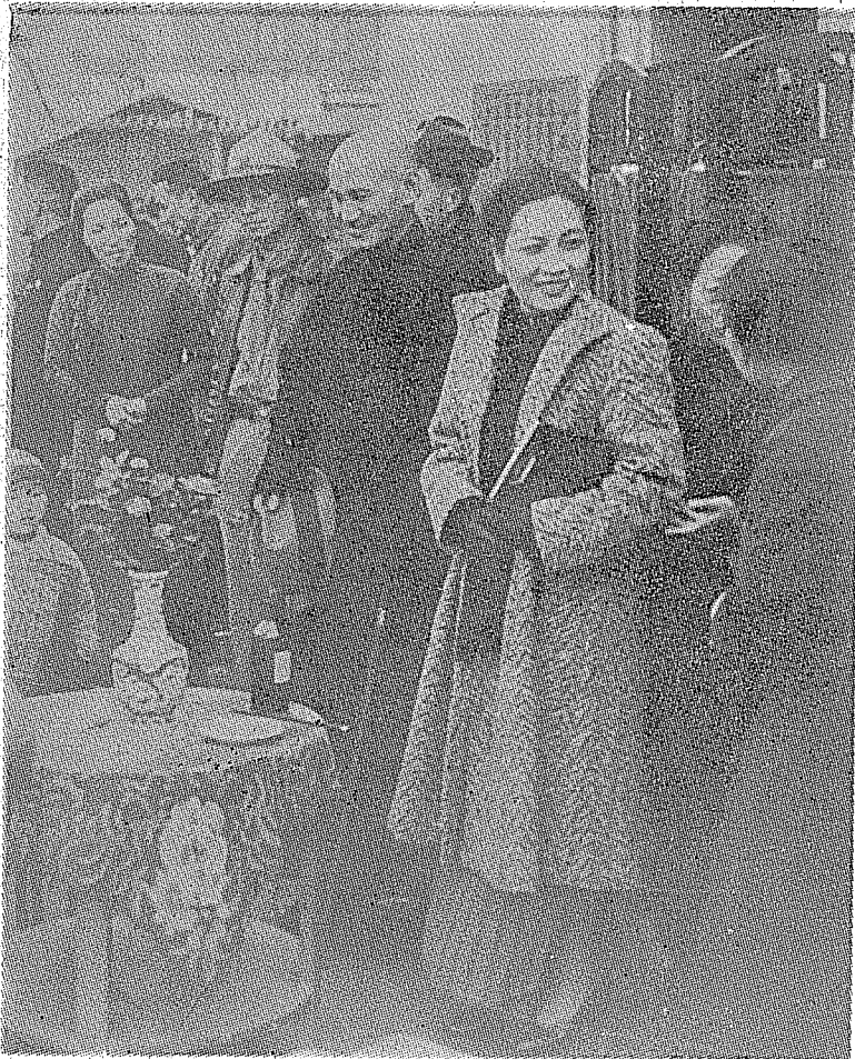
蔣介石在南昌發起新生活運動偕夫人參加民間集會時留影。

在民國十七年十月，公布訓政綱領。民國十八年，籌備地方自治。民國二十年五月，頒布訓政時期約法。民國二十年冬，以政治解決廣東省的抗命。民國二十二年、二十三年之交，平定閩變。民國二十五年六月，兩廣以抗日為名，出兵北上，蔣公寬大為懷，用政治方式解決，全國再告統一。剿匪期間，為求提高行政效率，民國二十一