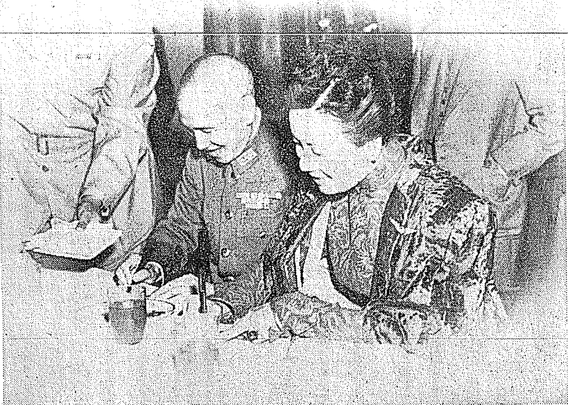
民國卅一年三月蔣公介石就任盟軍中國戰區最高統帥時與夫人宋美齡女士合影。

方為前方。國軍爭取主動，吸住日軍一百餘萬人。珍珠港事變後，是抗戰的第三期，與盟軍配合作戰，得美國空軍的幫助，反守為攻，直到日人投降為止。