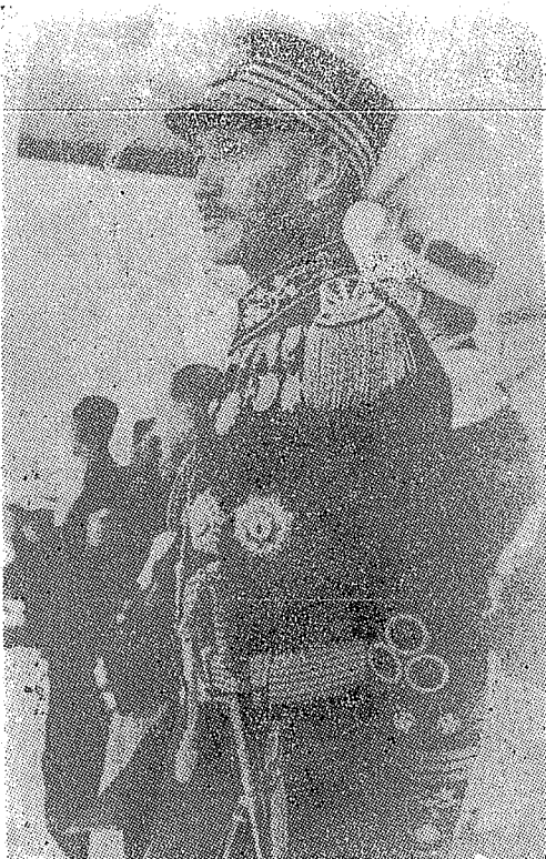
蔣介石在南昌主持新生活運動。

民國十七年，全國先後統一。蔣公於十月出任國民政府主席。二十一年三月，改任軍事委員會委員長，主持政軍大計，從民國十七年到廿六年抗日戰爭前爆發前，首尾十年，領導國家建設。對外自民國十七年七月起，與各友邦國家改訂