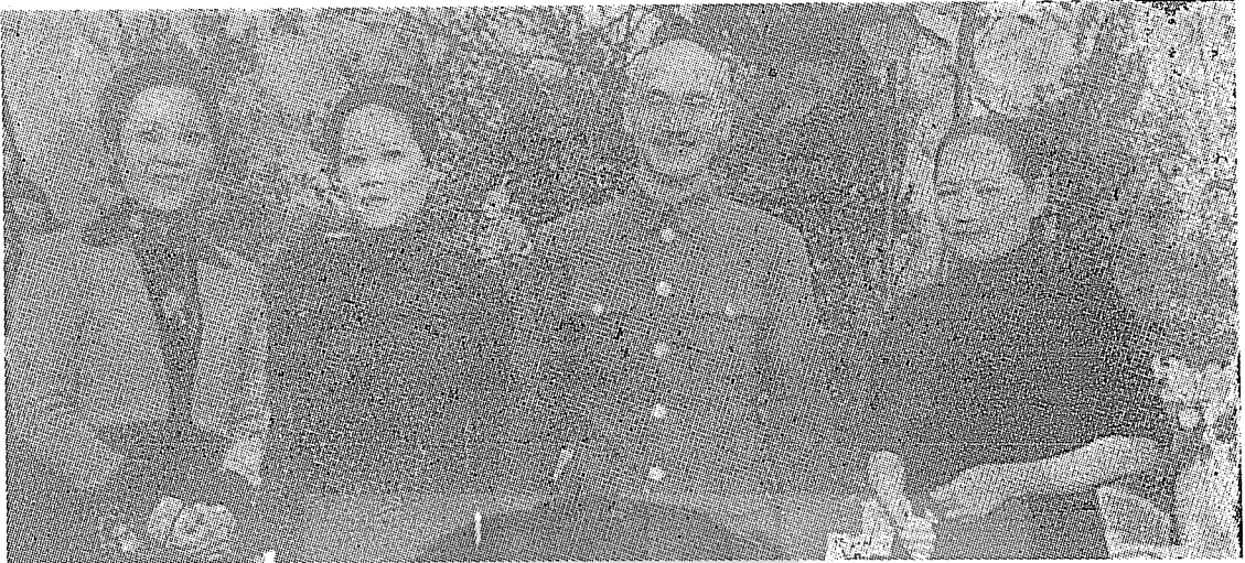
民國三十三年十二月，宋慶齡（右）搭乘國政府專機自香港脫險，抵達重慶，應蔣委員長之慰。

後又參予並擔任了共產國際的反法西斯常委員會的領導人之一，按這些不尋常的行動，絕非一個身為孫中山先生信徒的國民黨員所應為，相信此時她已參加了國際共黨外圍的組織行列，此時中共却派兩個工作人員參予她的左右，不過始終讓她披着國民黨的外衣和孫中山先生遺孀的身份，作有利于共黨的一切活動，她誤解了國父在民國十三年國民黨改組時的「三大政策」、「聯俄、容共」、「扶植工農」的時代背景和其真正的目標，當時俄國號召「反帝」、「反殖民」和援助「被壓迫民族的革命解放」，所以他允許共產黨員以個別身份參加國民黨的反帝革命陣容，但也特別強調了馬列主義非中國所必需，並不是允許共產黨摘取國民黨的革命果實，陰謀奪取政權，而當年國際共特鮑羅遜之野心已暴露無遺，縱然是中山先生在世也絕不容許共黨之陰謀得逞，不能不毅然清黨，趕走一羣背叛國家民族的野心政客和革命叛徒，身為孫夫人的宋慶齡女士何嘗不瞭解此一國民黨的基本政策和大道，居然一意孤行，甘心與共產黨為伍，離開了國民黨的革命行列，助桀為虐，國民黨何負於她，國父地下有知，亦為她的行為所不值，其情雖可憫，其行不可恕，千秋功罪，後世史家自有定評。