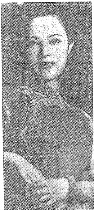
李香蘭（山口淑子）青年時代的照相。

最近日本報紙紛紛刊載名女人李香蘭的回憶錄，以及探討川島芳子生死之謎的文章。這兩個名女人都是中日戰爭期中活躍於日本或中國淪陷區偽政府的新聞人物。由九一八事變開始的十五年戰爭改變了整個亞洲的歷史，也使二千萬以上的人類慘死於戰爭的浩劫，這一悲劇永遠無法自中國人的腦海裏消失。尤其當年活躍於中日之間的女間諜沒落王孫川島芳子以及一曲「夜來香」風靡了中日人民的李香蘭，老一輩的人記憶猶新，年輕的一代也時有所聞，以下的報導是這兩個名女人充滿傳奇絢爛一生中，精彩的片斷。