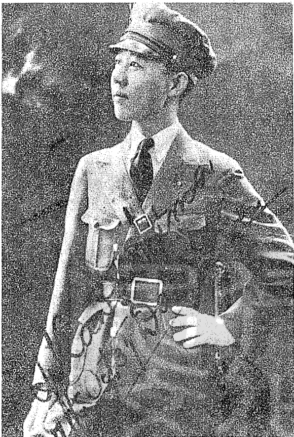
日本女特務川島芳子穿着軍裝在中國無惡不作。

一九四五年民國卅四年，李香蘭以漢奸的罪名被上海的軍事法庭起訴，李香蘭回憶說：「戰敗後我在上海由國民政府軍事法庭以漢奸罪審判，以李香蘭作藝名在歌壇所造成的形象使很多人不相信我是日本人，而以漢奸——中國人的賈國奴審判，有的報紙甚至刊出李香蘭已在賽馬場槍斃的新聞，有很多朋友趕快申請戶口謄本救了我一條命」。「昭和廿一年（民國三十五年）四月，我被判無罪，准許回國，在上海乘船，船要