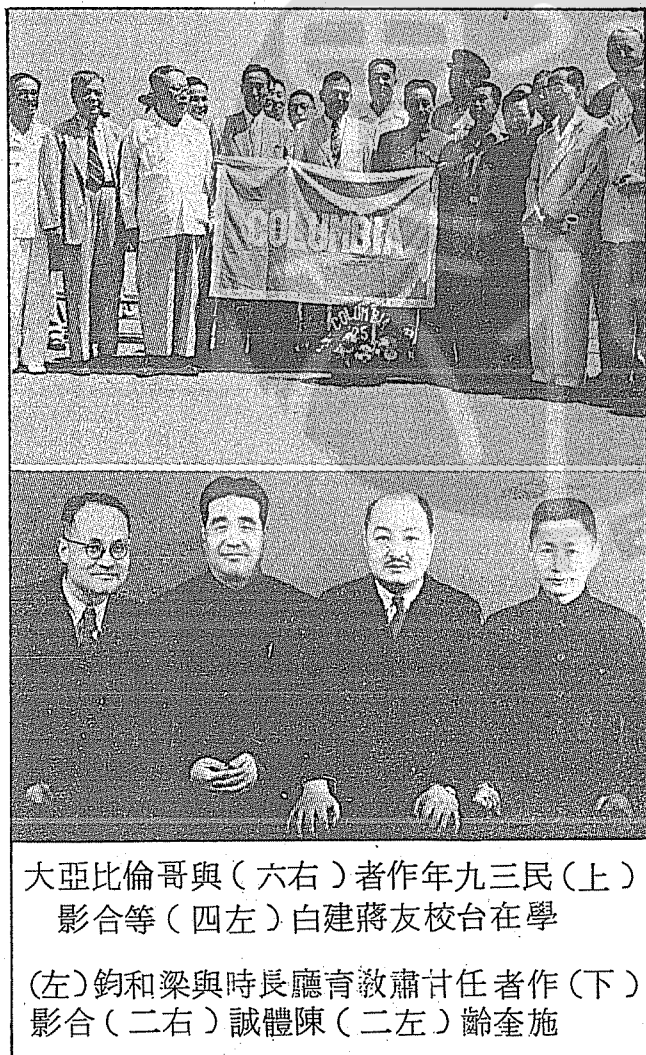
大亞比倫哥與(六右)者作年九三民(上) 影合等(四左)白建蔣友校台在學

國家多難，歲月如流，撫時感事，憂心忡忡，今後有生之日，當如何繼續獻身教育，克盡報國之天職於萬一，每一念及，又未嘗不惶悚而無一日安也。