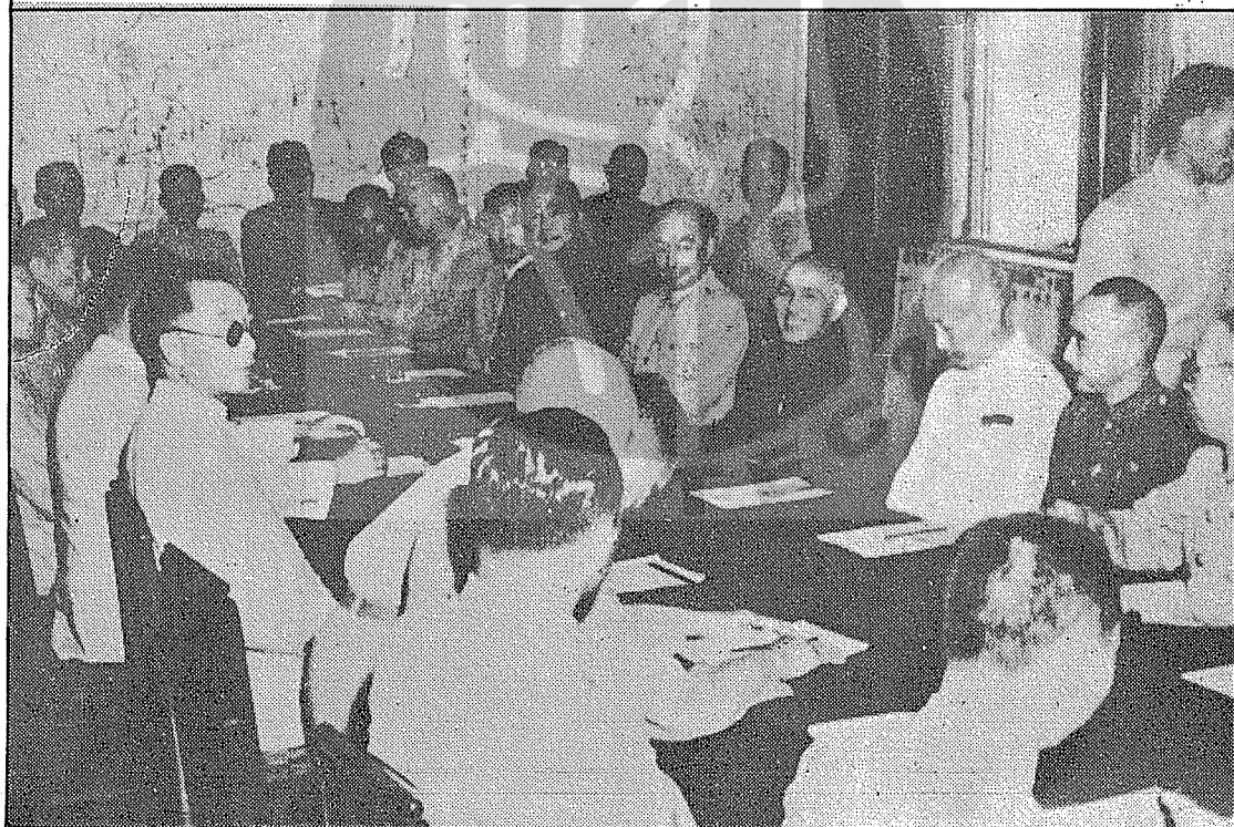
（二右）震孫與慶重在（四右）石介公蔣日九十二月八年八卅國民 影留時略方戰作討研軍將級高等（五右）南宗胡（三右）倫正谷 （頁十七見文）