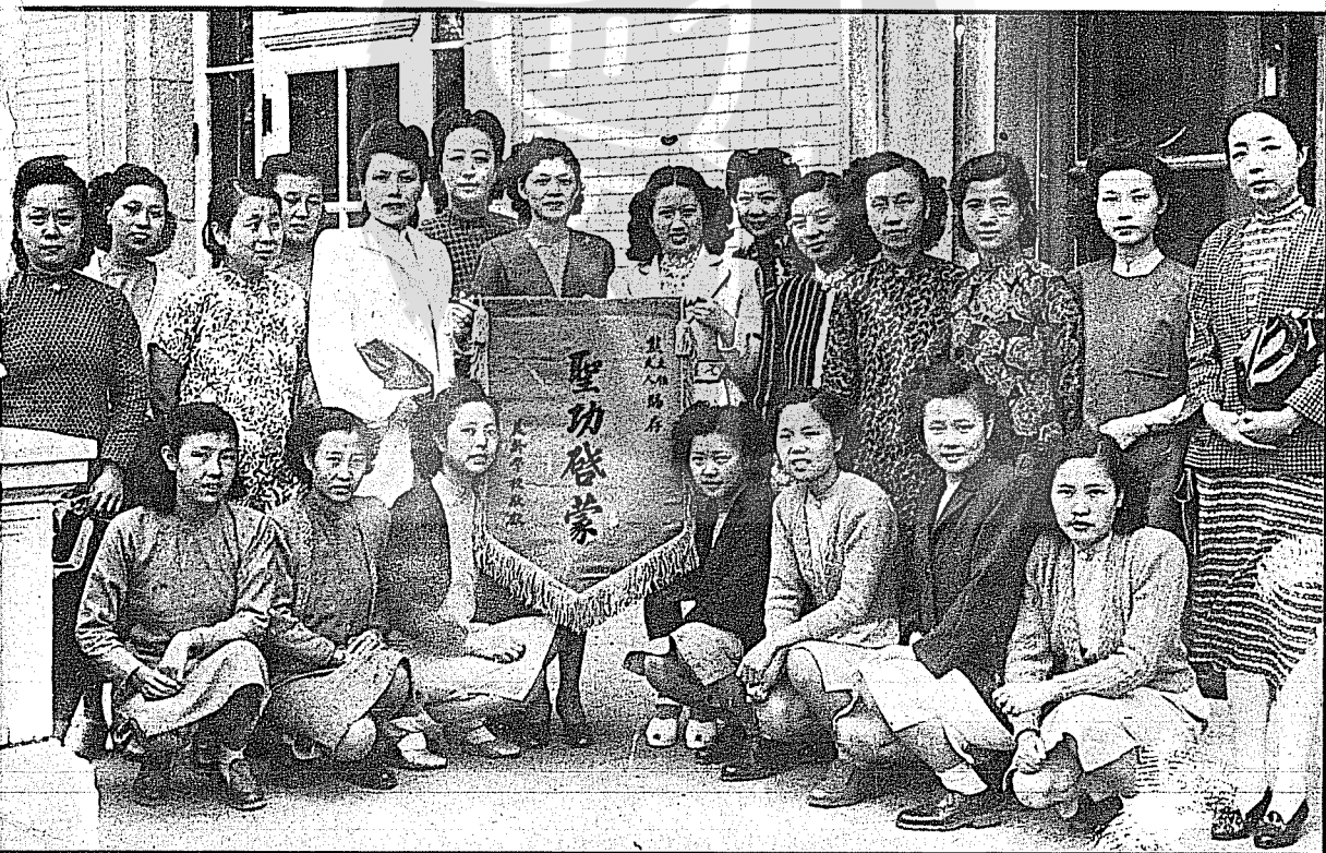
校創校學齡美陽瀋祝慶袖領女婦北東月五年六十三國民 白着三左，人夫輝式熊爲者旗錦持左中。念留影合年周 （頁三十見文）人夫庸馮爲者衣