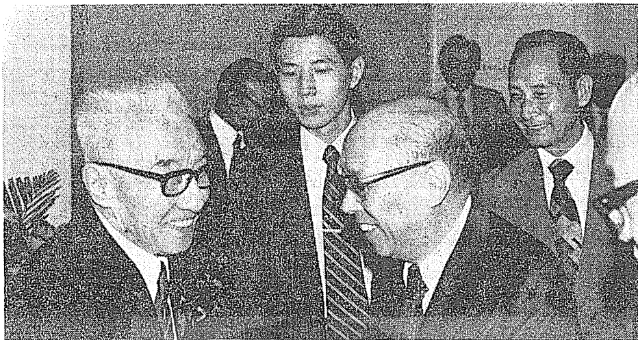
馮庸八十大慶嚴前總統家淦向馮氏祝賀。

准其經大連赴日長住。馮庸在日本化名湯鏡，以避日本特務耳目，表面上搭船赴美，中途在上海乘船登岸晉京，謁謁領袖 蔣公。蔣公對馮庸