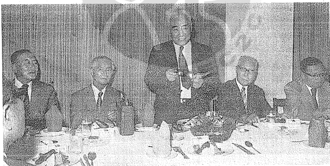
。蒸永方一右，平雲羅右，志長宋左。情神的時詞致宴遊友親受接慶大十七(中)庸馮