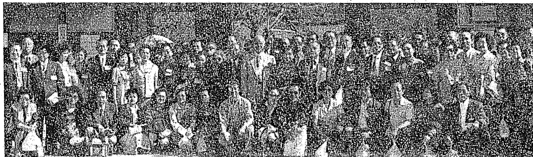
。婦夫鼎宗趙家作為中排三。影留前村俗民國韓在表代會總義親岡龍界世