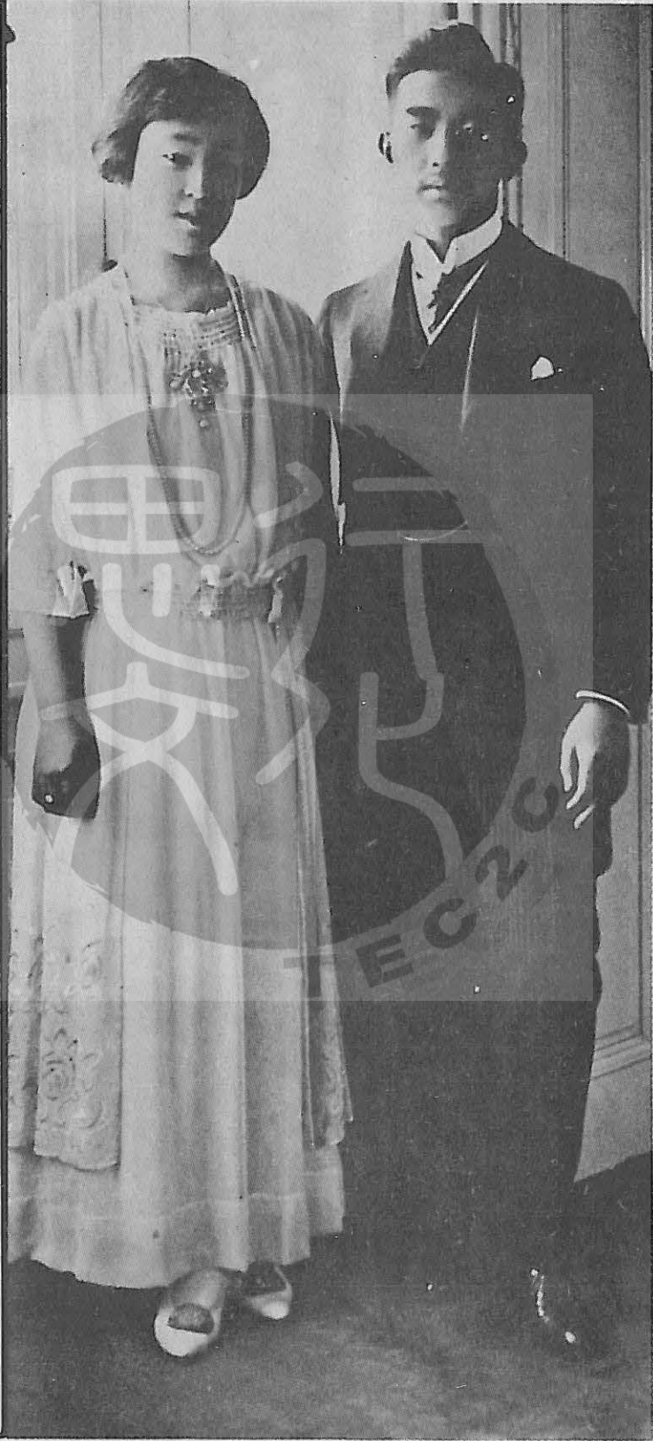
一九二五年三月三日裕仁天皇和久邇宮良子公主結婚合影。