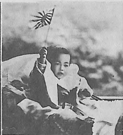
(上右)一九〇一年出生 八個月月的裕仁 (上左)明仁太子與正田 美智子結婚照 (下右)裕仁(左)與東鄉 平八郎元帥(右) (下左)裕仁接待英太子