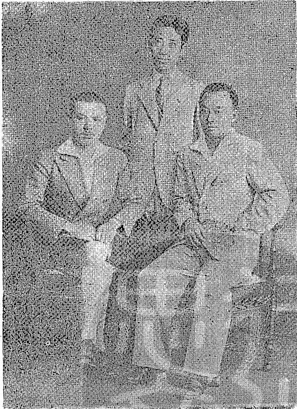
戴笠將軍（中）早期和好友胡宗南將軍（右）等合影。

特務處最初的十位同志是：戴笠、徐亮、周偉龍、張筱高、馬策、唐縱、張炎元、胡天秋、鄭錫麟，都是黃埔學生中的優秀者。不久派往各地工作的同志：南京方超、朱金驊、陳奠南、左曙萍，上海張業、鄧匡元、唐光輝，京滬路徐亮