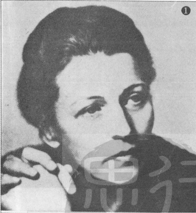
(上圖) 賽珍珠女士中年時期的照相。 (下圖) 賽珍珠在美國自宅和亞洲的孤兒一起玩樂。