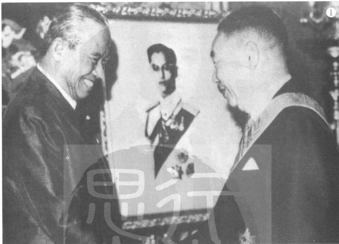
①他儂(左)與蔣經國(右)晤談時留影。