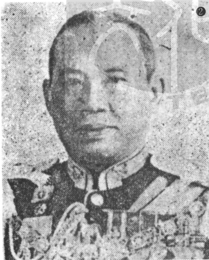
① 本誌創辦人王成聖教授（左）一九六四年訪問泰國與他儂元帥 （中）晤談，右為劉駁馭萬大使。 ② 泰國總理他儂元帥。