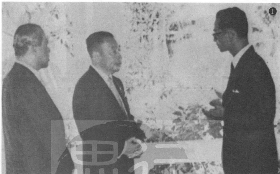
① 蔣經國（中）訪泰時由他儂總理（左）陪同晉見泰王蒲美蓬（右）。