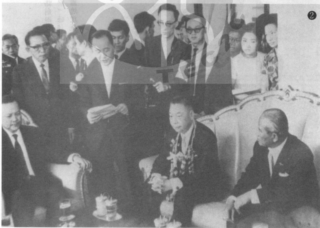
② 前右起：他儂、蔣經國會談。