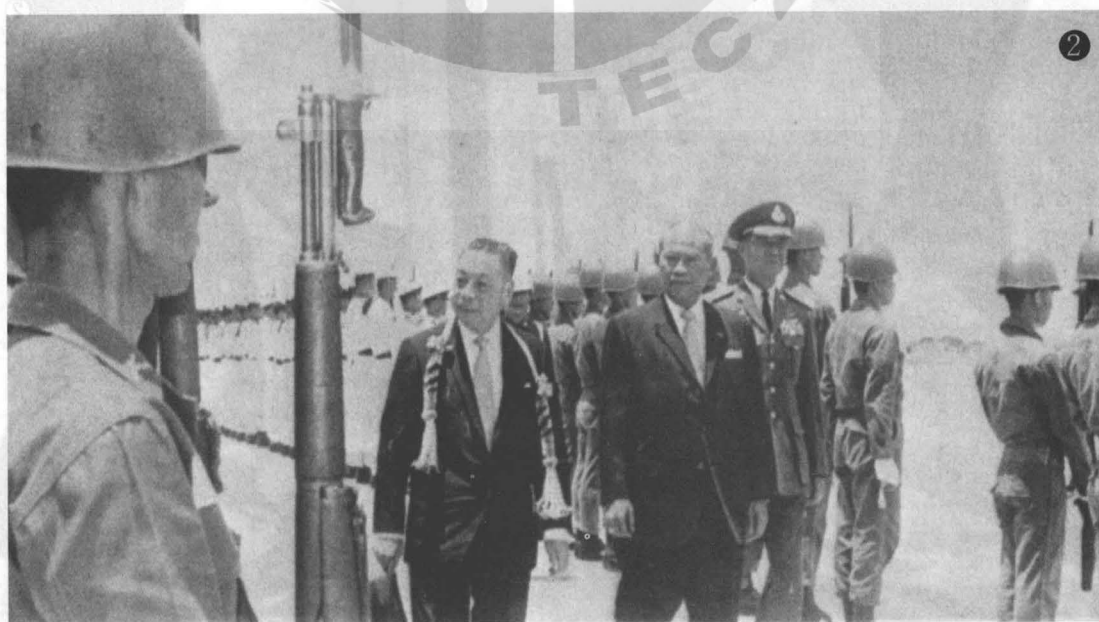
② 1969 年蔣經國(左二)訪泰時，由他儂總理(左三)陪同檢閱儀隊。