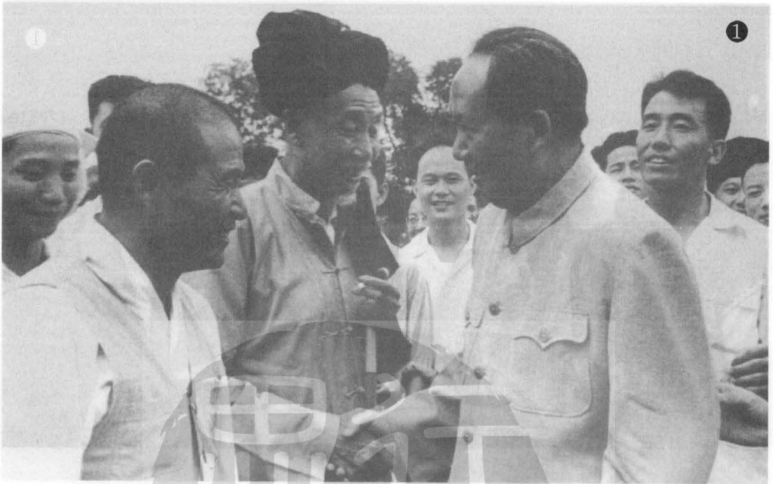
女「女陝」社國中區（中）報新新報子星澤毛著本日與平早（女）對昌國香朴① 。深合（左）熱英王負主 ①毛澤東（前右）與少數民族代表晤談時留影。 ②毛澤東（前左二）周恩來（前右）與民兵們合影。