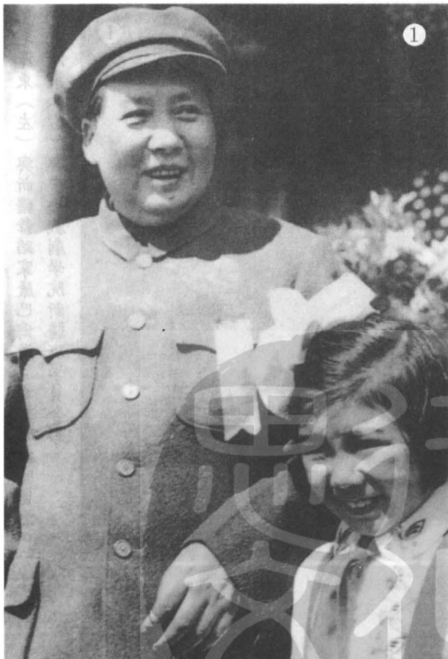
① 毛澤東(左)與小朋友合影。