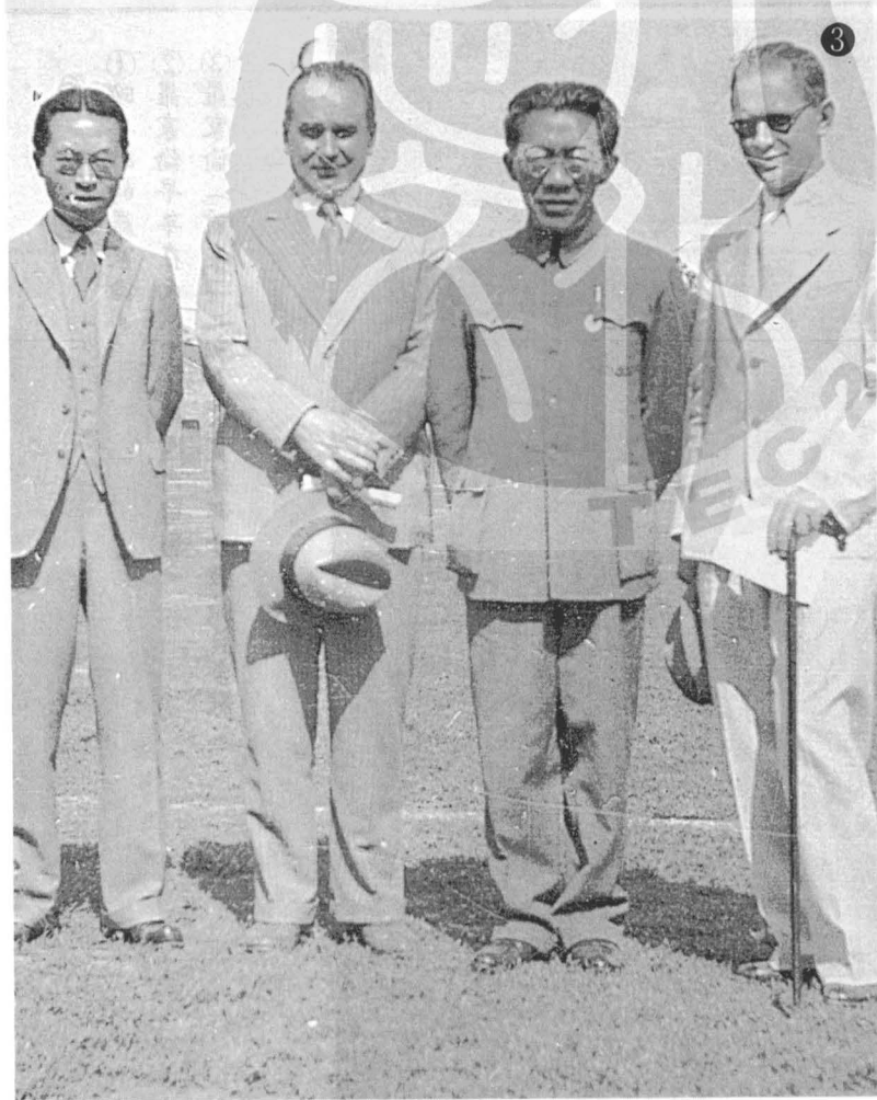
① 羅家倫（右）與尼赫魯（左）合影。 ② 與羅家倫同為北大傑出學生的段錫朋。 ③ 羅家倫（右二）早年在南京中大操場留影。