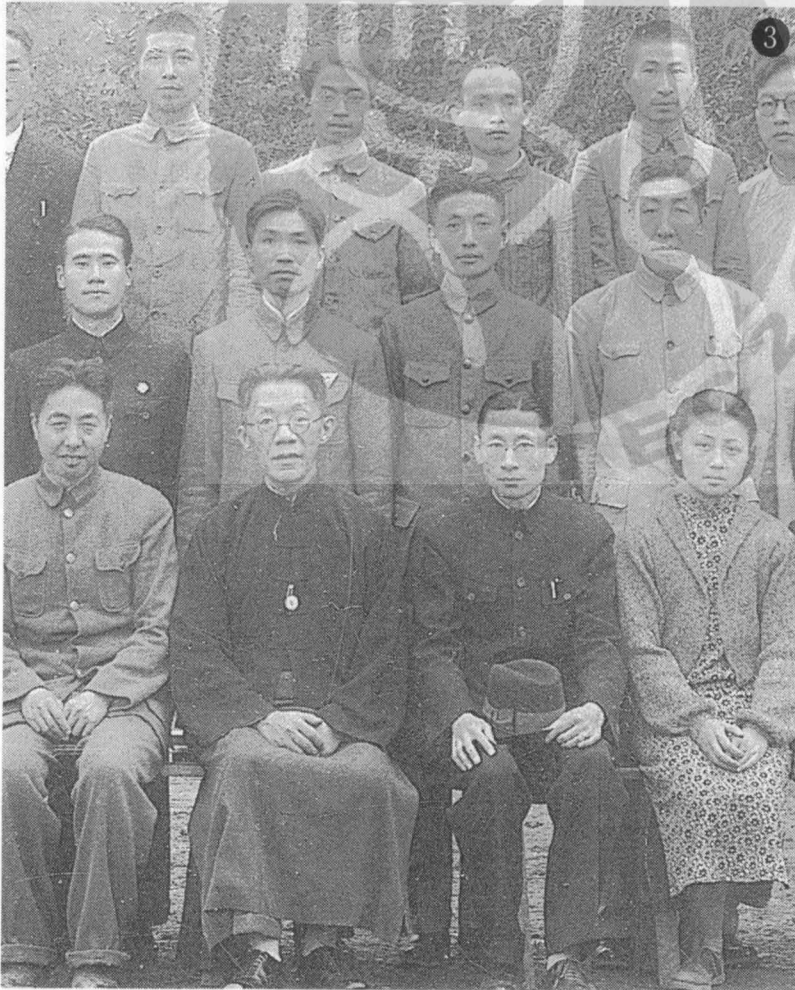
① 晚年時的羅家倫。 ② 羅家倫早年在南京中大校園內留影。 ③ 羅家倫（前左二）與中大實校部分教職員合影。