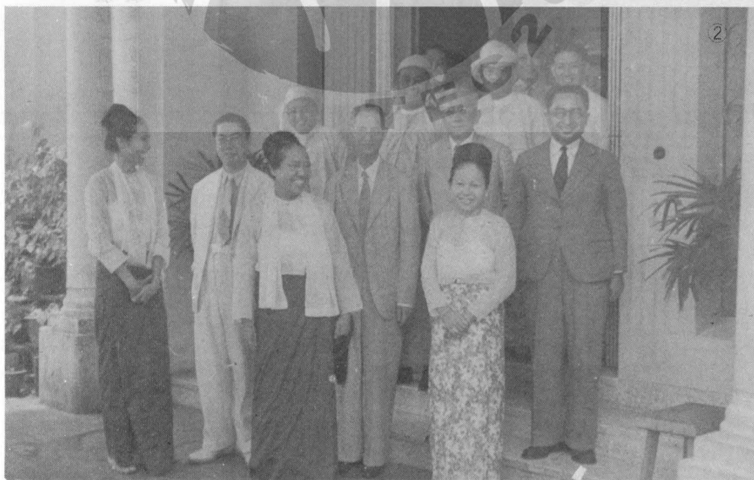
②曾養甫(左二)蔣夢麟(中)與緬甸首相宇蘇(右一)合影