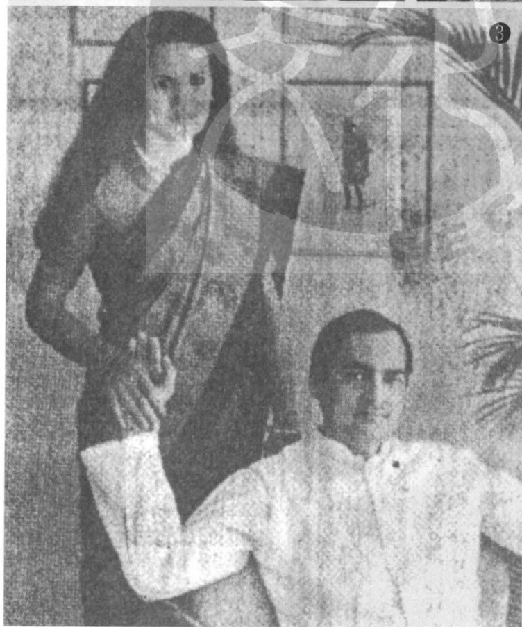
①年輕時的甘地夫人。 ②甘地夫人（前左）與兒子拉吉夫甘地（前左二）合影。 ③拉吉夫甘地（前）與夫人索妮亞（後）合影。