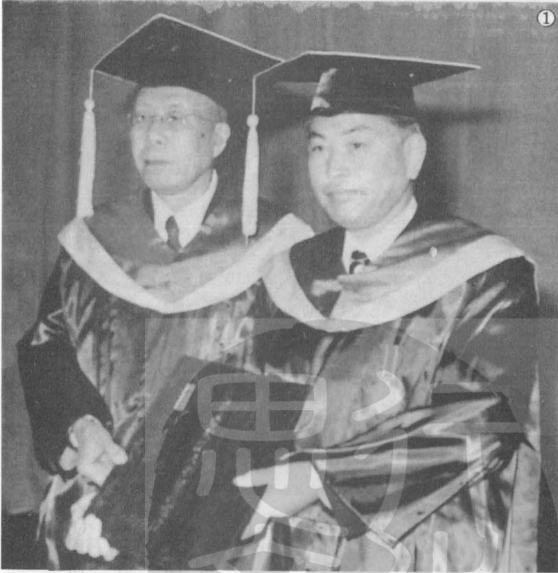
①張其昀博士（左）與日本產經新聞社社長鹿內信隆（右）合影。 ②張其昀博士（左二）與日本前首相岸信介（右二）合影。