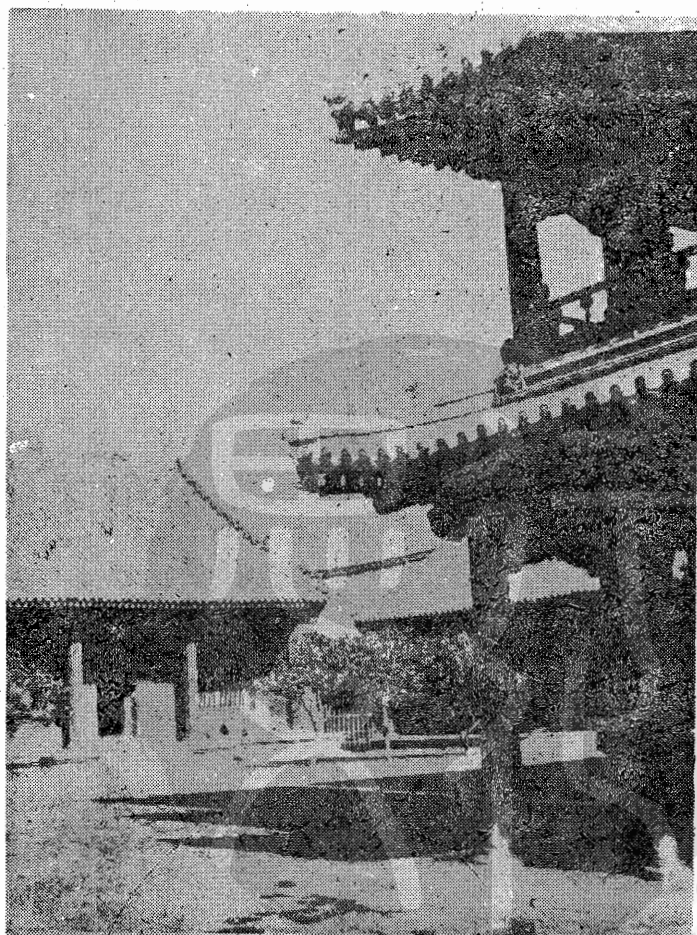
藩陽清故宮之一角

藩陽是北平而外，保存古代建築最多的一個城市；這是因為在清朝二百六十八年期間，始終