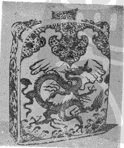
圖版三：明代青花瓷瓶

除瓷器外，尚有西魏石刻佛像，唐代石刻佛首，宋代木刻佛像，以及明代石刻觀音頭部等。