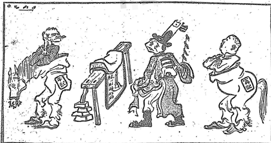
即將開演的傀儡戲，「上馬不得」