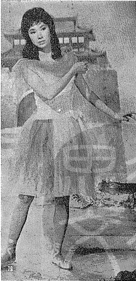
豔星樂蒂小姐表演「天堂舞」，舞姿妙曼，極受觀眾喜愛。