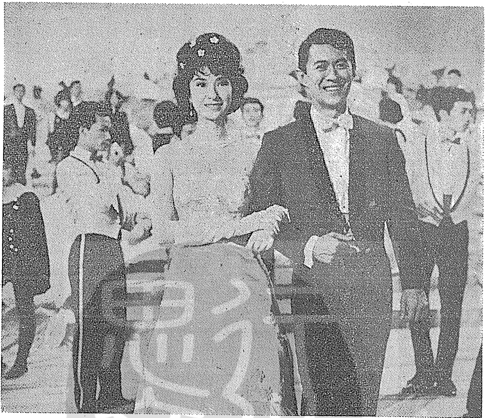
豔星樂蒂和男女藝員表演歌舞之神情。