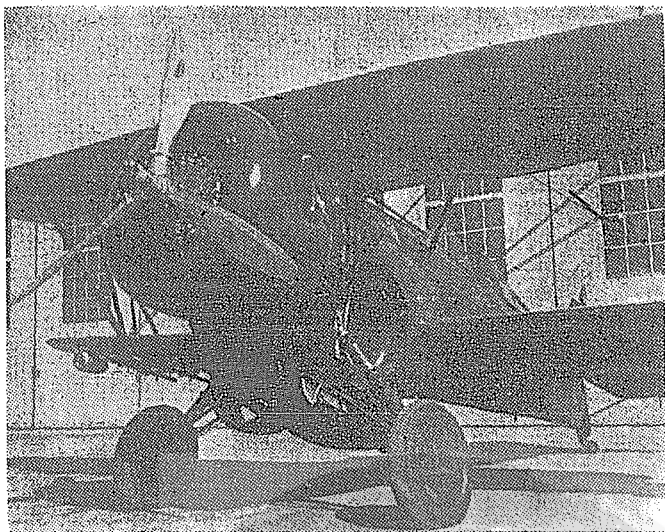
「八一四」空戰中首開六比〇紀錄的高志航座機。