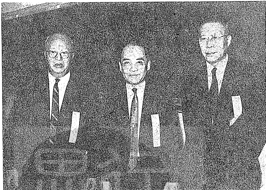
中大五十五週年校慶大會時前教育部長鍾皎光 (中)國防研究院主任張其昀(左)與本文作者(左)合影