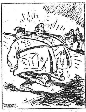
要意德二國退出西班牙是很容易的。