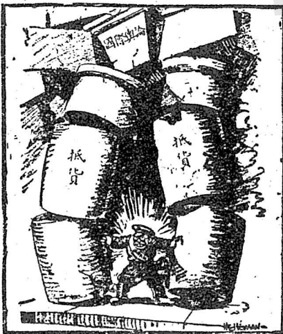
美國 Morning News