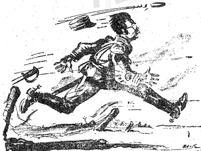
— New Masses