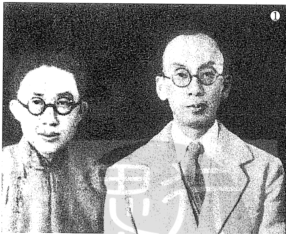
①黃自（左）與蕭友梅（右）合影。