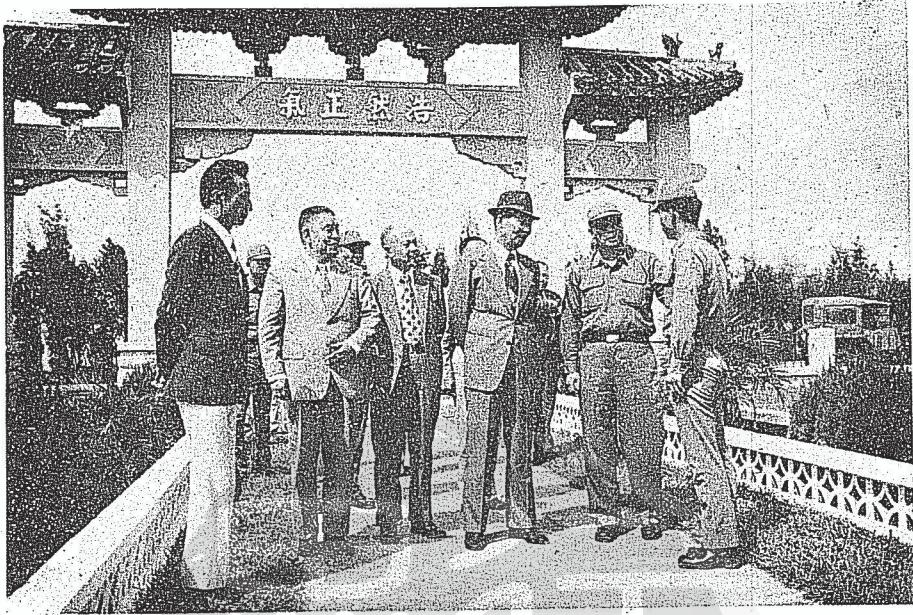
3. 在金恭祭陣亡將士後攝於「忠烈祠」前