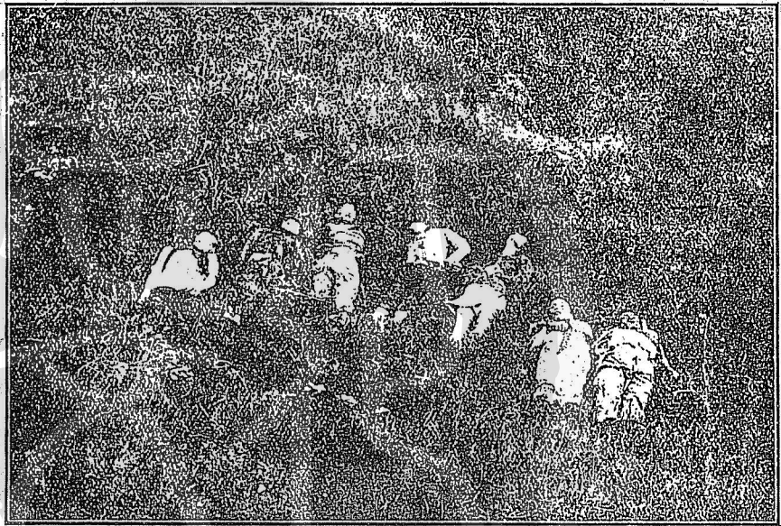
革黨七名在山上之狀

19760 出至二堂前道。衛兵伏擊之。多槍斃。生擒者二人。革黨紛竄。衛兵多傷者。時督署西偏箭道火起。延及二堂。衛兵仍專力截擊。水提及各路援兵皆到。與革黨巷戰良久。復分投圍捕。餘黨散匿。閉城嚴搜。二更火熄。當革黨撲督署時。另分一股往劫軍械庫。以有備被擊退。又分十餘人出歸德門。十餘人出大南門。迎堵外來援軍。由歸德門入援之官軍。與革黨遇於高第街。擊斃革黨一名。餘黨紛竄。水師之登岸者及水陸各防兵。由大南門入。至雙門底。與革黨遇。迎頭痛擊。革黨奪路向內城逸。擒一人。革黨並分一隊搗旗下街。以先已戒嚴。不得逞。被旗兵轟斃多人。是役共斃革黨二十餘人。生擒八人。官軍亦有死傷。訊生擒之革黨。均直認不諱。並稱該股共有三百餘人。由香港及省外分搭輪船火車。陸續來省。原擬二十六二十八日起事。均因準備不及。改遲初一。因今日三點鐘。同志九人被獲。