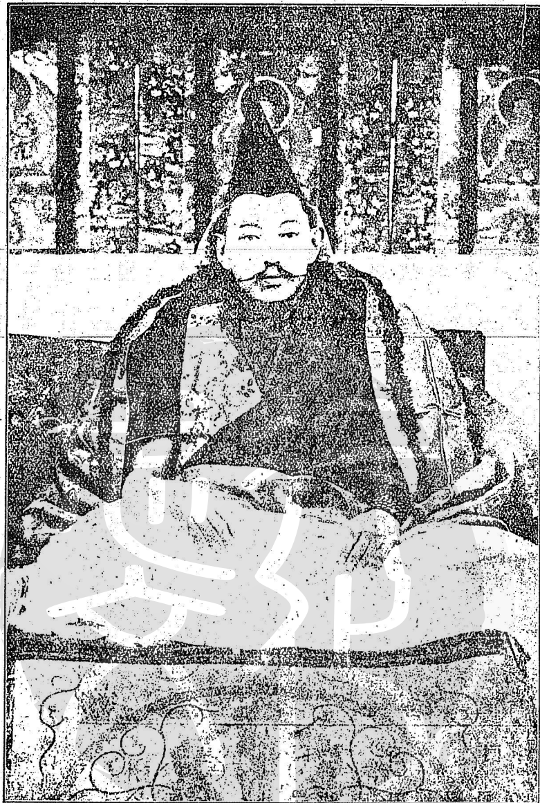
已革第十三輩達賴喇嘛

祕密入藏。為達賴畫策。購置火器。意圖抗英。英雖偵知之而 無如何也。至是。俄方東困於日本。不暇遠略。英遂藉事稱兵。 詔駐藏大臣裕綱往解之。達賴恃俄員為謀主。不欲和。思 與英人一戰。乃止裕綱行。弗使番民支烏拉。(按烏拉即夫馬)