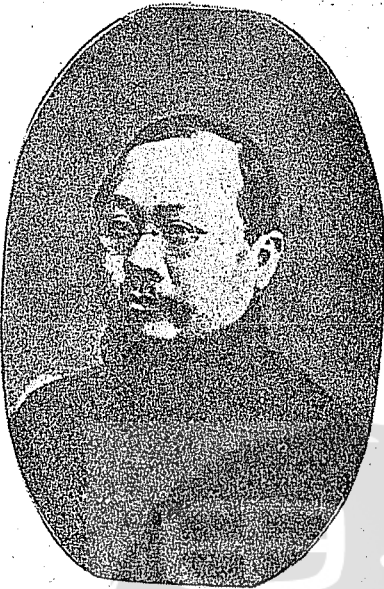
中國第一任財政總長陳錦濤，係由國父親自提名。

京召開各省代表會議，以謀統一。經數度會商，乃於陰曆十月二十六日選黎元洪黃興先生為正副大元帥。但以黎不能南來，黃亦力辭，並聲言要等候。中山先生歸國。中山先生適於陰曆十一月初六日抵滬，初八日黃興先生赴南京，向代表會提出：一改用陽曆。二起義時用黃帝紀元，應改為中華民國紀元。三政府組織採總統制。均獲同意。遂於十日開代表大會，計十七省代表四十四人出席，定每省投一票，不記名投票，結果中山先生得十六票，黃興先生得一票。旋由代表會推派王寵惠陳陶怡先生等，携同證書赴滬，歡迎大總統晉京就職。中山先生於陰曆十一月十三日（民國元年元旦）就臨時大總統職，即以諮議局原址作為總統府。任命各部首長如下：內務總長程雪樓，外交總長王寵惠，財政總長陳錦濤，司法總長伍廷芳，教育總長蔡元培，陸軍總長黃興，海軍總長程璧光，交通總長湯蟄仙，總統府秘書長胡漢民，並申令頒布國號為中華民國。