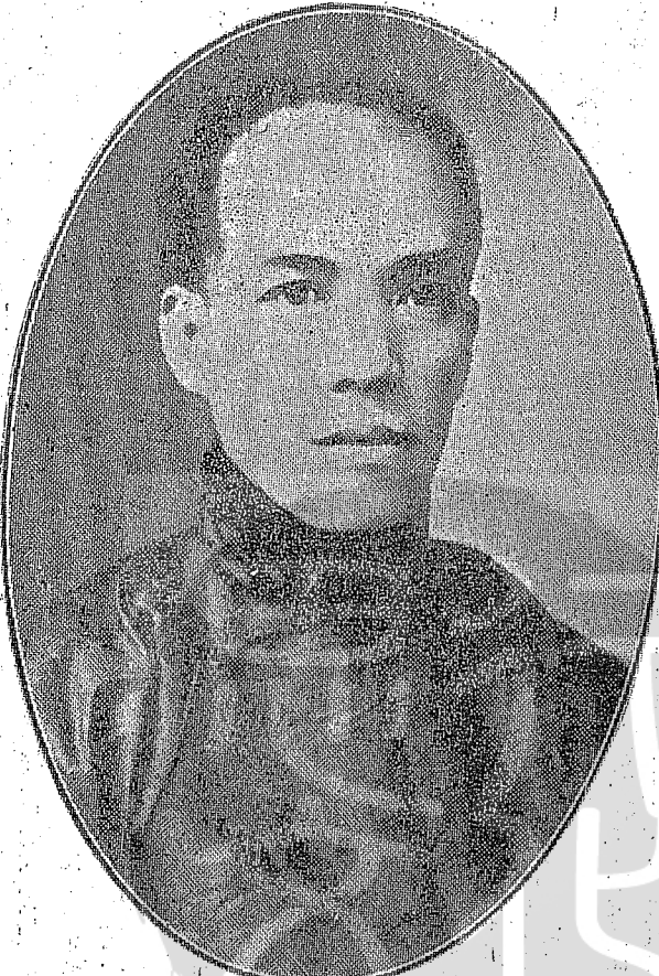
咸年時期的梁啓超