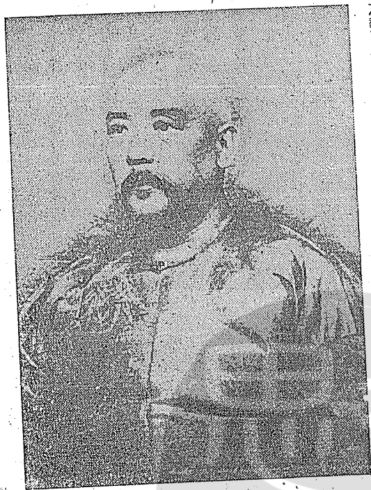
前清時代的袁世凱

袁世凱成為民國總統後，改北洋六鎮為北洋六師，並且大事擴充，使之成為全國最強大之武力，而永為渠個人所私有。民國二年，更使人刺國民黨代理事長宋教仁於上海，國民黨與南方各省無從遏忍，癸丑二次革命遂起。袁世凱趁此時機，使北洋軍大舉南下，長江南北，悉成北洋軍之勢力範圍。彼之爭奪面目既已揭露，於是戕革