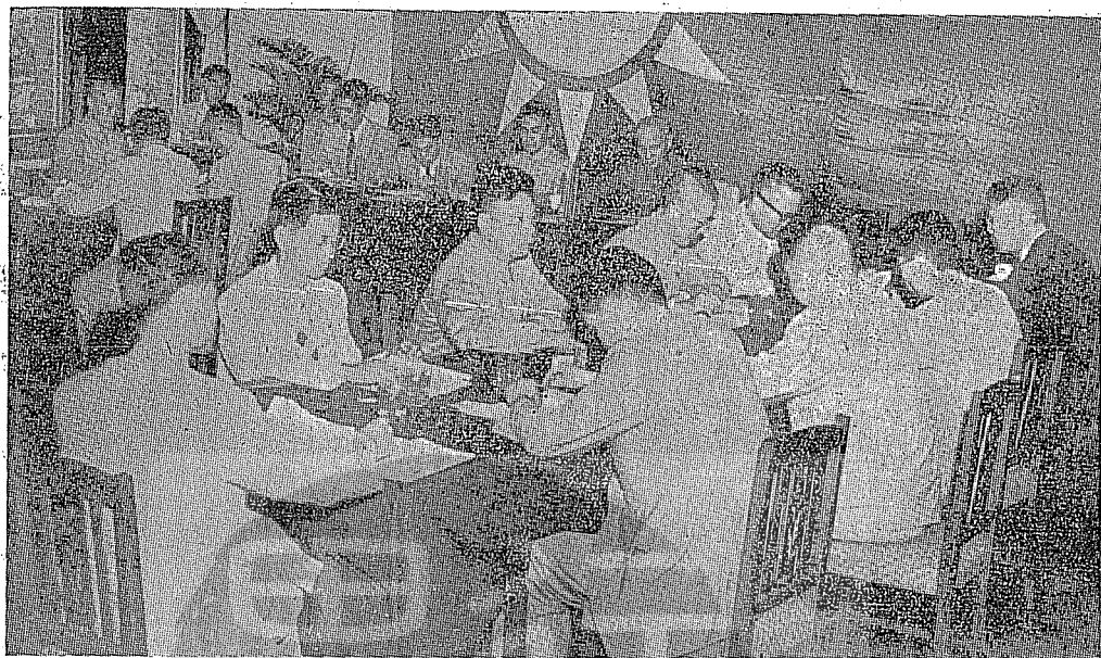
蔣總統親自主持中國國民黨中央改造委員會