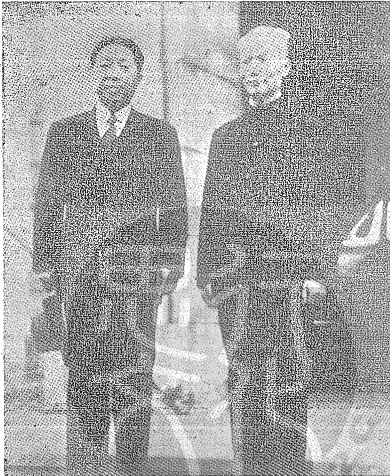
席魏道明合影。 民國三十八年一月陳誠就任臺灣省政府主席，接篆後與其前任亦即首任主席魏道明合影。