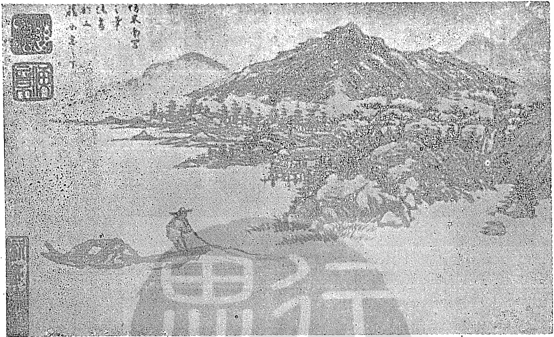
。章便的禧慈有鈴，畫水山的繪所法筆宮南米仿禧慈