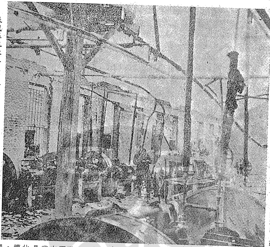
蘇俄在東北劫走重要工業設備，圖為劫後的殘破情形。

資本、利潤，對外係以共產國際為利器，遂行侵略。繼承沙皇時代帝俄侵華之傳統政策，蘇聯利用沙皇時代之侵華利益，如西伯利亞、蔥嶺以西