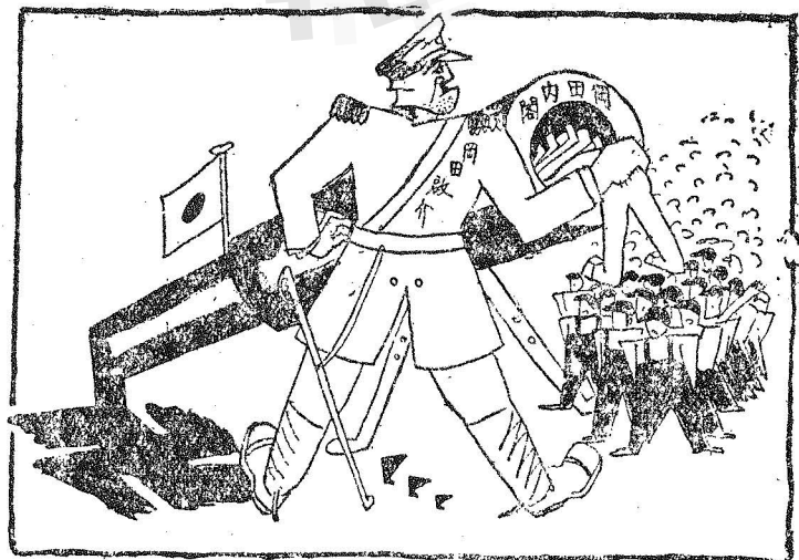
日本閣內閣之出路

七月三十日，下院討論空軍五年計劃案時，工黨反對派會提出彈劾案。當經代理首相 鮑爾溫 答辯，開陳英國環境必須擴充空軍之理由。其中最警闕者曰：吾人不能忘懷者，即自航空術發明以來，曠昔之國界業已消失，苟吾人念及英國之國防，則已不在多佛海岸之懸崖絕壁，而在於 萊因河 上。蓋 萊因河 今已成爲吾國之國界矣。英國各報評論 鮑爾溫 之斷語，認爲歐戰以後英國說明外交政策最嚴重而最大膽之辭句云。下院卒以四百零四票對六十票否決工黨彈劾案，贊助政府空軍擴張案。