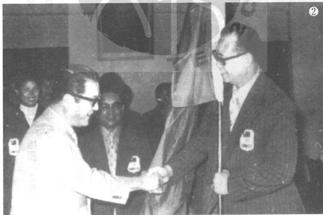
②徐亨（右）早年接受教育部蔣彥士部長（左）授旗參加慕尼黑奧運會。