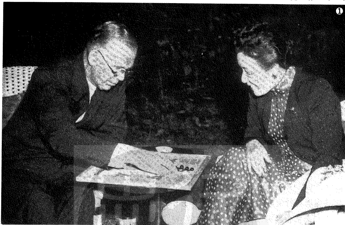
① 蔣夫人宋美齡女士（右）與馬歇爾在牯嶺下棋時留影。