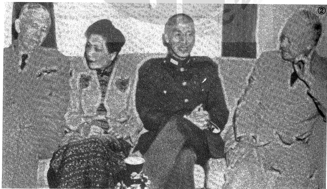
② 一九四六年蔣介石主席（右二）偕夫人（左二）與艾森豪元帥（右）馬歇爾元帥（左）在南京合影。