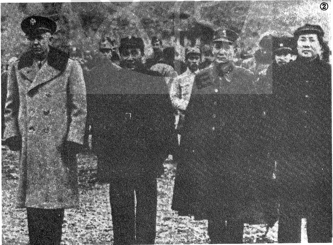
②馬歇爾（左一）與張治中（右二）飛抵延安，朱德（右三），毛澤東（右）在機場迎接。