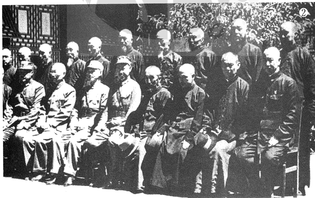
②馬步芳（前排右五）與蔣中正（前右六）及青海蒙旗各族王公合影。