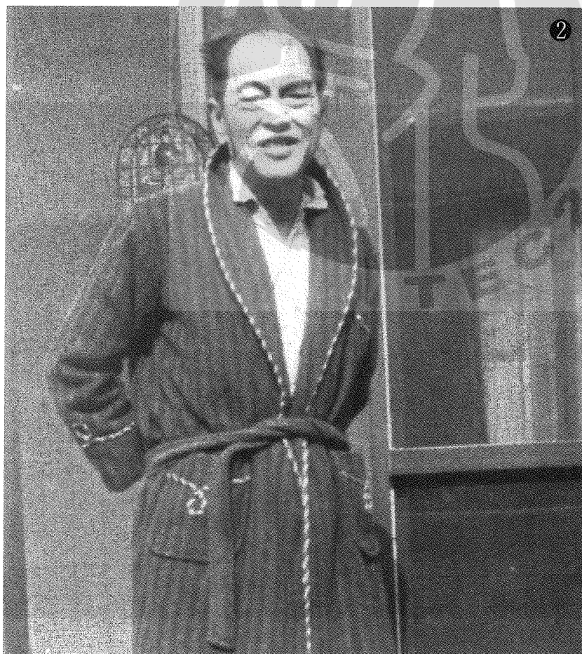
① 李惠堂（中）與黎玉璽（右）鄭為元（左）晤談時合影。 ② 老年時期的李惠堂。