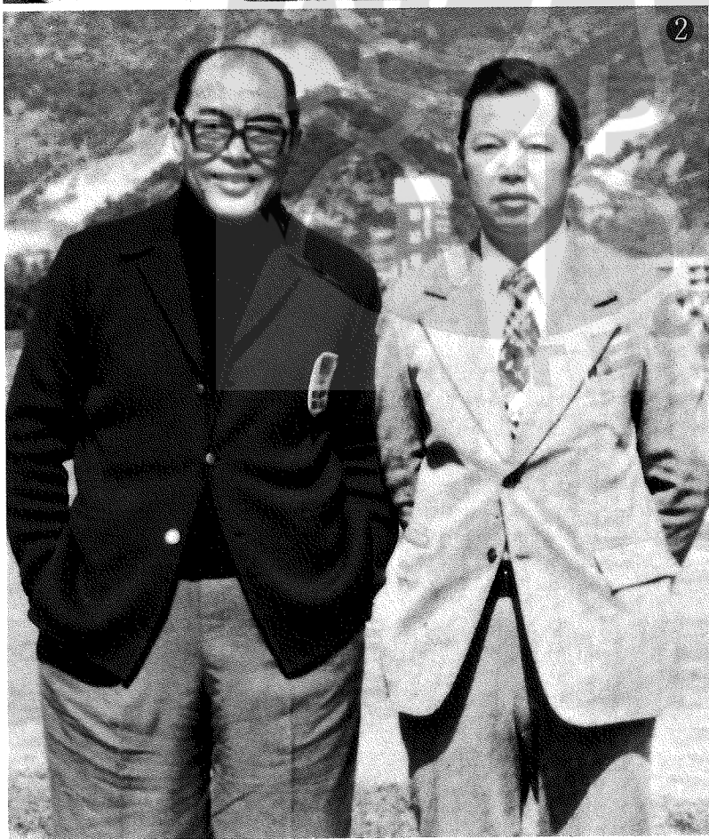
① 一九六五年李惠堂（左）與楊森（右）晤談時留影。 ② 作者汪清澄教授（右）一九七五年在台北與球王李惠堂（左）合影。