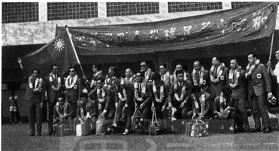
①李惠堂（後排左七）率足球團回國，受到各界熱烈歡迎。