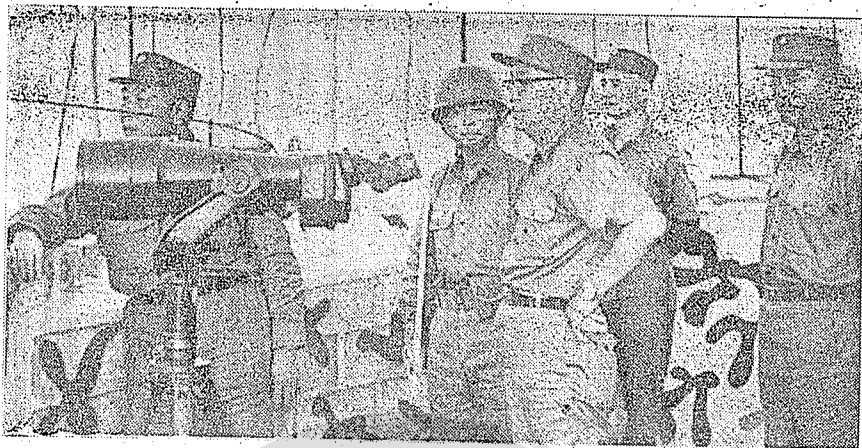
民國五十六年七月陳大慶將軍（右三）視察金門陣地時留影，左為尹俊將軍。

籌兼顧，以促進整體發展；一方面又需權衡輕重緩急，使施政形成重點。省政建設的目標，就是為民衆謀福利。無論任何行政措施，都要以民衆的利益為依歸，與民衆的願望