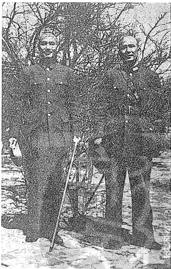
民國二十七年三月台兒莊大捷時最高領袖 與白崇禧將軍（右）合影。 蔣委員長（左）

體。其實他們這些「前進人士」別有用心，因為香港在抗戰期中及勝利後，已成為中共在華南的活動中心，為便於和香港聯絡起見，他們選擇梧州，作為據點。如果他們因鬧事而遭受取締，他們在一夜之間可以逃到香港，省政府遠在桂林，實在鞭長莫及。據朱家驊部長告訴我：教育部所得的報告現時西大的左傾分子，將近一百人，真正是共黨職業學生的，至少也有三十多個；準備再調查清楚，然後將一份黑名单交給陳校長，等我們到校之後，開除他們的學籍。同時必須將學校由柳州鶴崗江和梧州蝴蝶山遷回桂林良豐花園和將軍橋中央電工器材廠舊址，重新加以修建，教育部除撥款外，並請廣西省政府幫忙。話雖如此說，但我不知道陳劍脩校長的立場，能否堅定，有沒有這種魄力來對付左派學生的挑戰。我很顧慮自己的才力薄弱，和西大又沒有歷史關係，恐怕辜負健公的期望。」他說：「我一定告訴他與你合作，清除校中