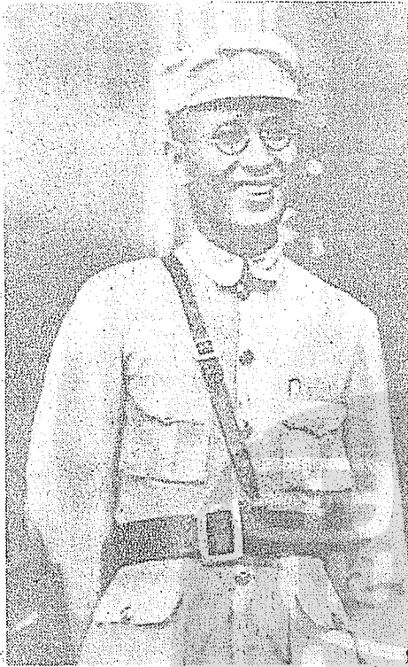
任浙江省政府主席時期的白崇禧將軍。

白先生這時担任定桂軍（李宗仁部隊）和討賊軍（黃紹竑部隊）聯合作戰的參謀長及前敵總指揮官，張任民任總參議。我和任民為柳州同鄉，本有認識，由他介紹見過李宗仁，並請吃飯，承允維持柳州中學，不讓軍隊借住，並幫助解決學校經費一部份的困難。也見過白健生。他那時不過三十一歲左右尚未結婚，遙想公瑾當年，雄姿英發，如今回憶起來已是半個世紀以前的事了。在這半個世紀中，時事滄桑，風雲變幻，英雄造時勢，抑時勢造英雄，若要臧否人物，那歷史的棺是真難蓋的。只見江山如畫，人世上多少豪傑，都隨着時間消逝了。想起桂林和柳州的山水風