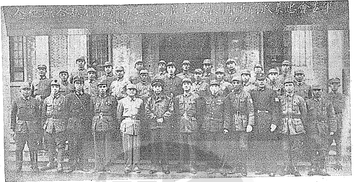
抗戰勝利，戴笠將軍與從事抗戰日情報之忠義救國軍高級官員合影留念。

修配零件，以克難方式維持通訊。又因為手搖發電，音響很大，決不能在淪陷區使用。而電池的儲藏運補，在敵前敵後，極為危險困難。