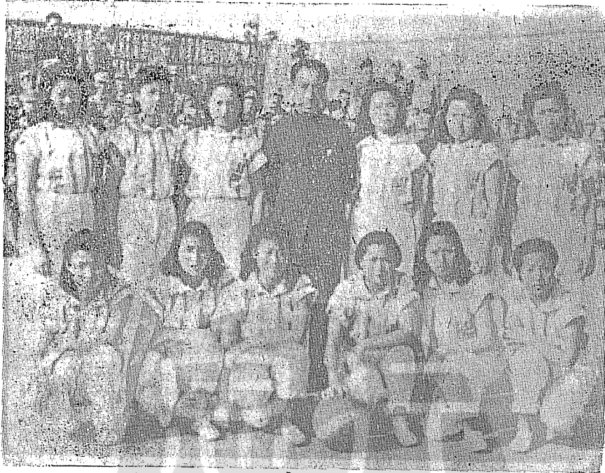
謙遜週到的戴笠將軍和工作同志合影。

撫洲自願做縣長，更能學習地方行政。於是先奉派到鳳翔，做了三個月縣長，再調蒲城。蒲城是井岳秀、楊虎城等軍人的故鄉，號稱難治。舉例來說，當時陝西全省積欠的田賦是六十四萬，而蒲城一縣就欠了六十二萬，其難治可見一般。王