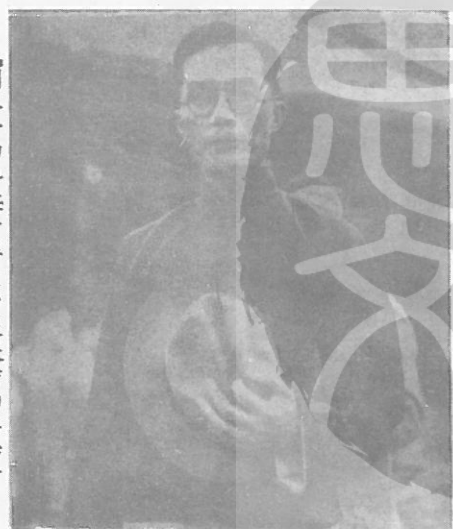
→民國二十四年任清華大學校長時的梅貽琦年四十歲。