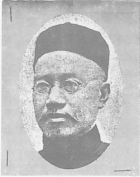
→辛亥京師大學堂總監督北京大學第一任校長嚴復遺照。