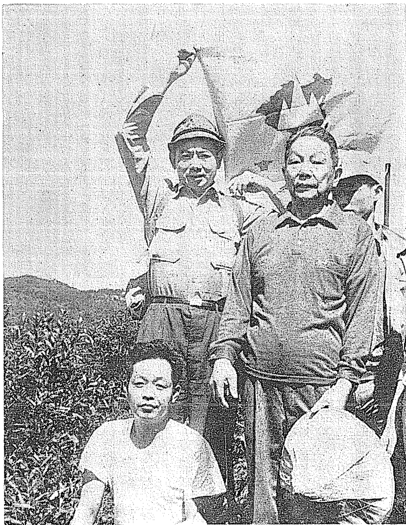
楊森將軍（右）九十歲壽辰帶領登山協會會員登山時留影。

民國廿四年，共匪西竄滇邊，楊森奉命攔堵追擊，駐軍雲南昭通，駐留一久，引起龍雲關心，特派飛機一架，迎他到昆明作客，楊與龍雲過去在滇，由於知己好友民國初年任滇軍旅長的黃毓成的介紹，曾相結識，並且曾經比賽騎馬射擊的技術，彼此仰慕武功，爲了化解龍對他的疑慮