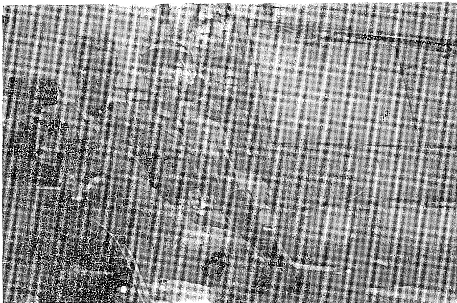
楊森將軍（坐於蔣公之後）任貴州省主席陪侍 國民政府主席 蔣公巡視貴陽市區