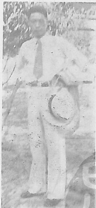
本文作者民國二十二年在上海市政府實習留影。

民國廿二年十一月底，學校曾分發同學五人到江蘇民政廳服務，我正好在分發同學五人中，時顧祝同先生任省府主席，民政廳長為辜任發先生，省府派我同學五人為民政廳服務員，月支薪俸七十元大洋，辜廳長以我等在民政廳無適當事情可作，特派我等到江蘇省會警察局服務，每一分局一人，負責調查轄區戶口，衛生，烟毒，賭博及警政實施情形，當時各分局長深感恐慌，不安於位，對之頗為冷落，因之我等服務抱負，雖未能施展，然對於警政腐敗情形經過半年調查，則瞭如指掌，迨至省府改組，陳果夫先生主政，余井塘先生任民政廳長，我們數次晉謁廳長，要求即以服務員的津貼經費，略予補助，送我們赴日考察，或出發青島北