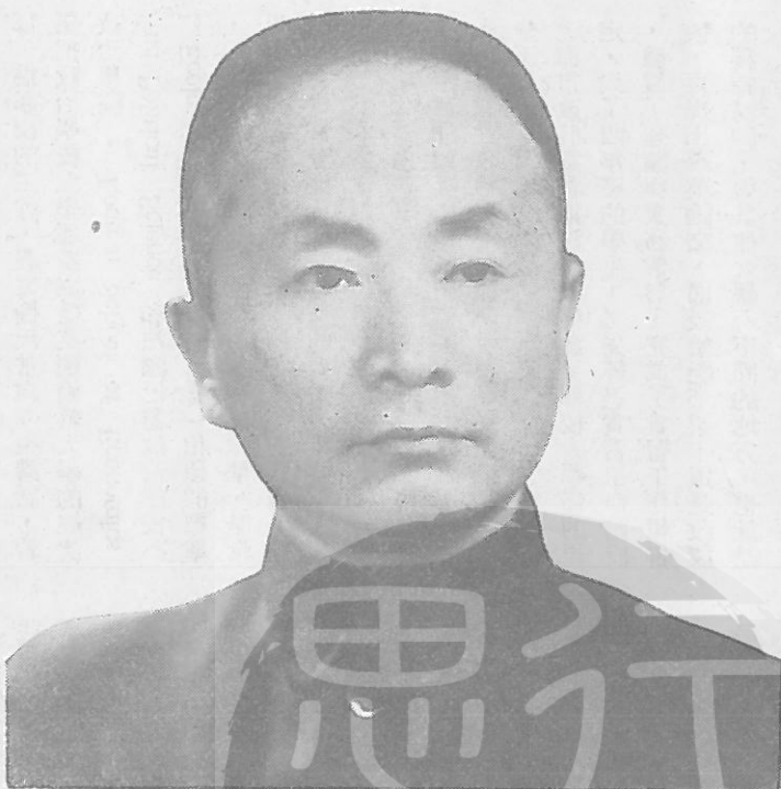
繼續祝同將軍任江蘇省政府主席的陳果夫先生。