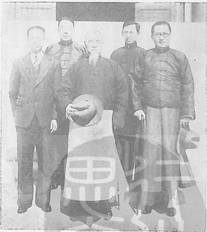
民國二十二年上海市政府秘書長俞鴻鈞（左）陪同市長吳鐵城在市政府門前迎候林森主席合影留念。

莫名其妙，即調閱發文，果然是寫錯了鬧成笑話，立即下令將總務處長記大過一次，繕寫，校對，一律革職，此令一下，上海報紙，紛紛刊載，本是小消息，便成大新聞，此事雖小，影響甚大，從此，亦可以看出辦理公事的不容易，更可以看出俞鴻鈞氏在上海市政府秘書長任內的鋒利作風，由於這個事體的刺激，使我以後處理公文格外的小心謹慎。