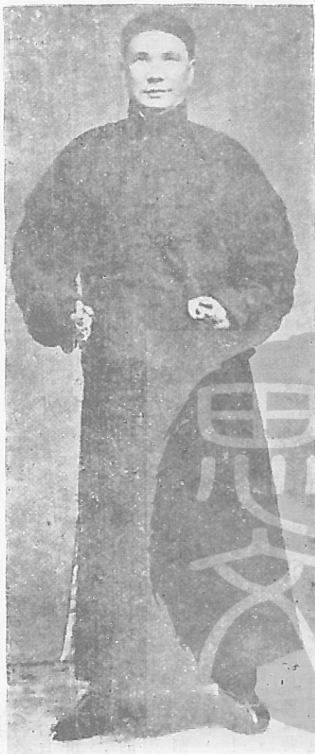
丘逢甲先生遺照之一，時年四十歲。

到了民國十三年，我在高師畢業後，奉派參加考察團赴日本考察教育，在東京得與倉海先生的長公子丘琮（念台）兄認識。他是當時留學日本東京帝國大學，代表留東學生團體負責接待我們的。民國二十四年我應邀從歐洲回國任國立中