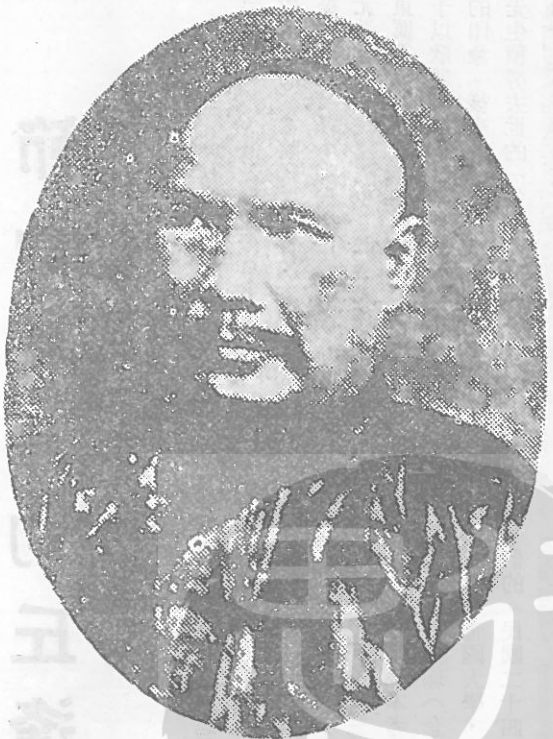
丘逢甲倉海先生四十五歲時攝於廣州，是年被推為中國革命同盟會領東盟主。

當甲午（註三）中日戰事初發，倉海先生對台灣前途便深為憂感，知道日本野心勃勃，早就垂涎台灣。於是召集鄉民予以訓練，每以大義喚醒同胞，為保家衛國，維護祖宗廬墓而準備抗拒外國的侵略。當時，清廷尚未有割台之議，但先