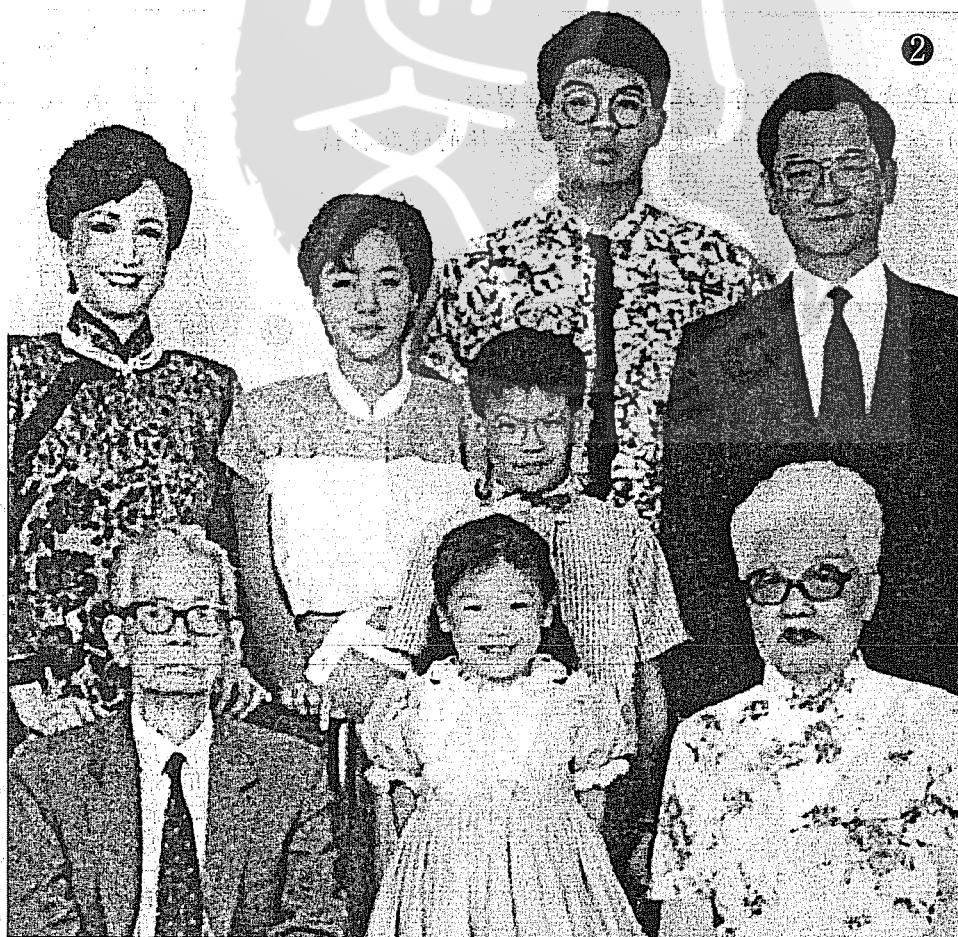
①連戰（左二）任台大政治系及政治研究所主任時，偕夫人連方瑀（左一）與學生們歡敘時留影。 ②一九八四年連戰（後右）偕夫人（後左）與父母親及男女公子合影。