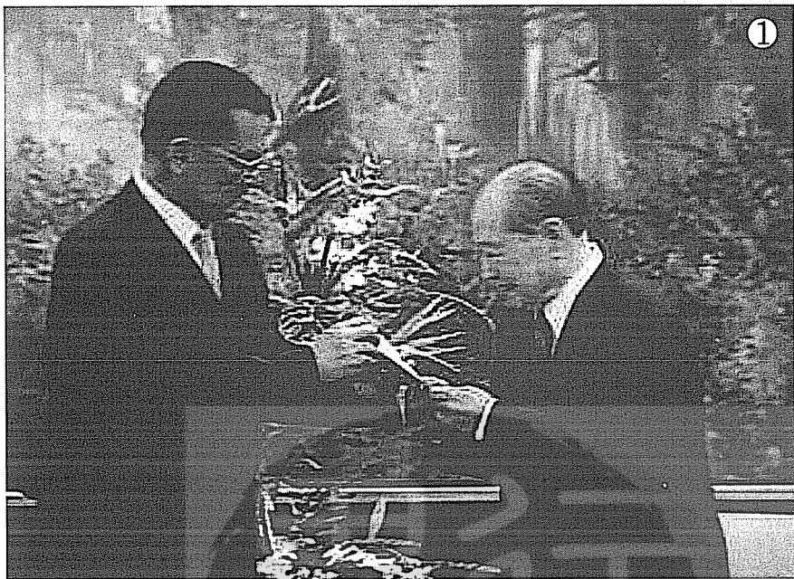
①連戰（左）與大陸海協會會長汪道涵晤談時留影。