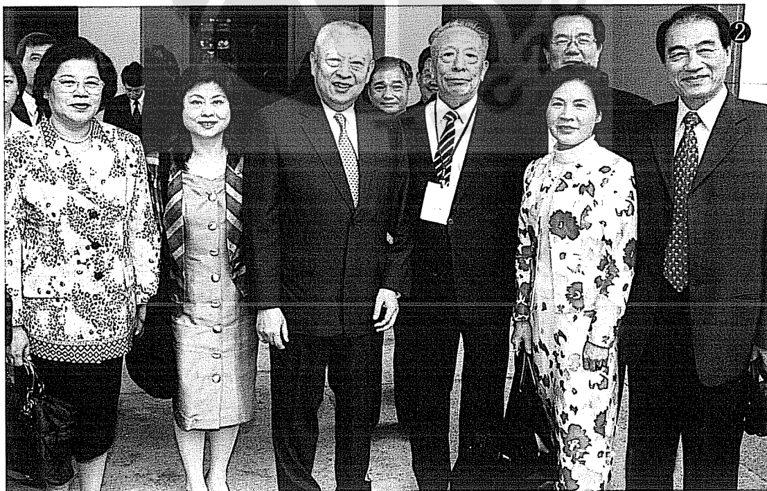
②作者邊境（前左四）二〇〇二年六月偕立委蔡鈴蘭（左一）、朱鳳芝（左二）、張蔡美（前右二）等拜訪香港特首董建華（左三）在香港長官公署會客廳合影。