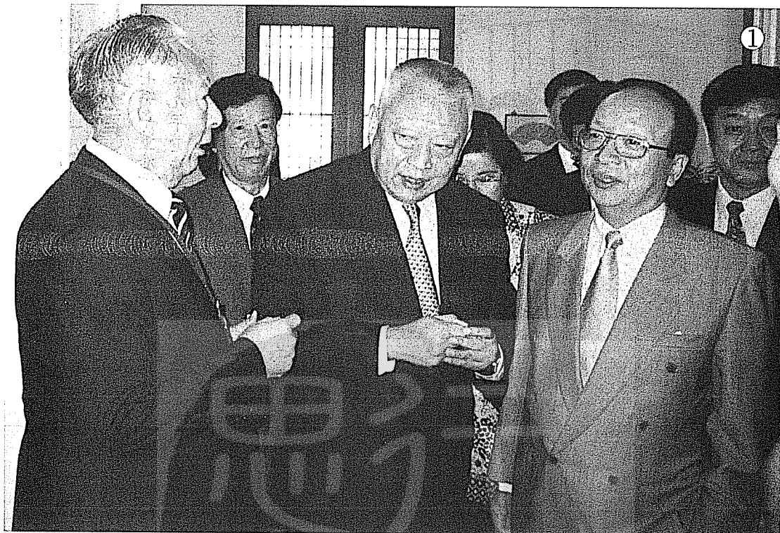
①前排左起：作者邊境、董建華、蔣孝嚴等在香港長官公署會客廳合影。