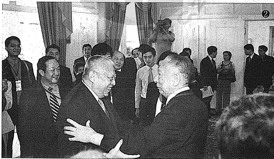
②作者邊境（前右）與香港特首董建華（前左）晤談時留影。