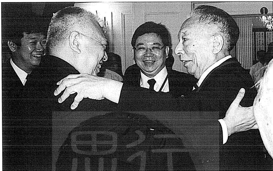
①二〇〇二年六月廿三日作者邊境（前右）與香港特首董建華（前左）在香港長官公署會晤時留影，中為台北市旅遊職業工會總幹事馬潮。