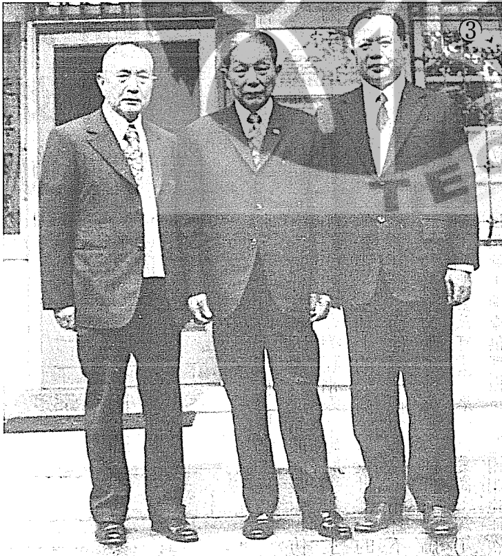
① 國畫大師張大千（左）與夫人徐雯波也是老少配婚姻。 ② 從事旅館、美容業有成的何麗玲，企圖心強旺，不讓鬚眉。 ③ 抗日名將楊森（中）的婚姻生活，既老少配又妻妾眾多，頗富傳奇性，圖左為國代王聯奎，右為作者劉昌博教授。